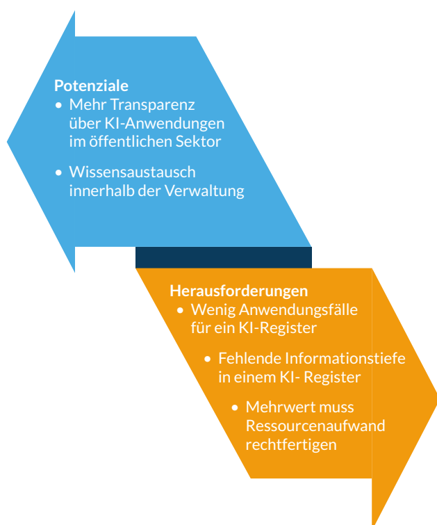
ABBILDUNG 2 Übersicht der Potenziale und Herausforderungen eines öffentlichen KI-Registers

Aus den Ergebnissen der Interviews und Workshops wurden Herausforderungen und Potenziale identifiziert (s. Abbildung 2), die im Folgenden weiter erläutert und ausgeführt werden. Dabei unterstreichen jeweils Zitate der Teilnehmer:innen die einzelnen Erkenntnisse. Abschließend werden Empfehlungen für die Umsetzung gegeben.